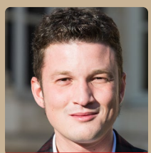
Edouard BÉNARD député de Seine-Maritime