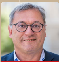
Nicolas SANSU député du Cher