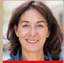
Soumya BOUROUAHA députée de Seine-Saint-Denis