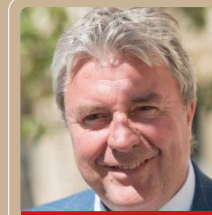
Jean-Paul LECOQ député de Seine-Maritime