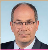
Emmanuel MAUREL député GRS du Val-d'Oise