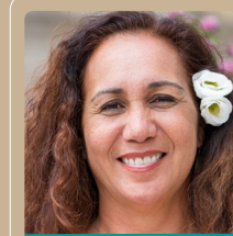
Mereana REID-ARBELOT députée de Polynésie