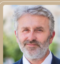
Yannick MONNET député de l'Allier