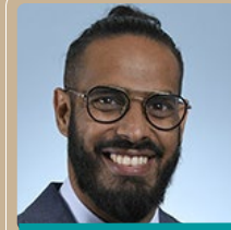
Frédéric MAILLOT député de la Réunion