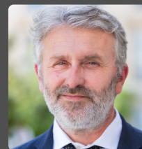
Yannick MONNET député de l'Allier