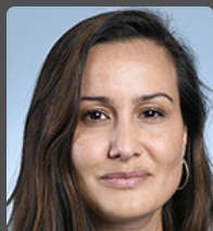
Emeline K/BIDI députée de la Réunion