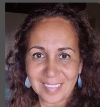
Mereana REID-ARBELOT députée de Polynésie