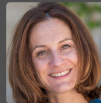
Elsa FAUCILLON députée des Hauts-de-Seine