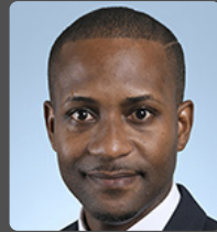
Jiovanny WILLIAM député de la Martinique