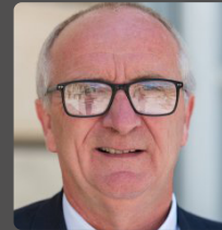
Jean-Marc TELLIER député du Pas-de-Calais