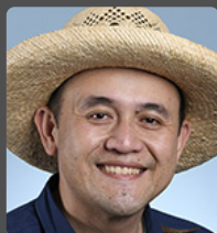
Steve CHAILLOUX député de Polynésie