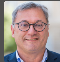
Nicolas SANSU député du Cher