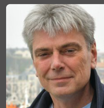
Sébastien JUMEL député de Seine-Maritime