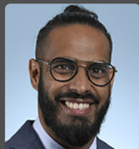
Frédéric MAILLOT député de la Réunion