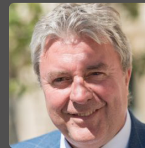
Jean-Paul LECOQ député de Seine-Maritime