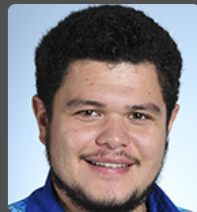
Tématai LE GAYIC député de Polynésie