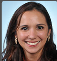
Karine LEBON députée de la Réunion