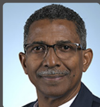
Jean-Victor CASTOR député de Guyane