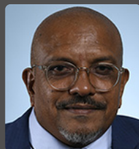
Marcellin NADEAU député de la Martinique