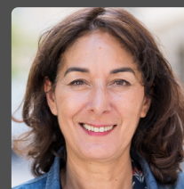
Soumya BOUROUAHA députée de Seine-Saint-Denis