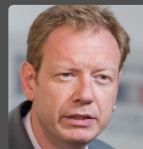
Pierre DHARRÉVILLE député des Bouches-du-Rhône