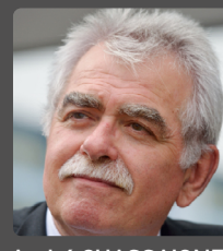
André CHASSAIGNE Président de groupe député du Puy-de-Dôme

Après une première lecture au Sénat, les députés examineront en juillet la proposition de résolution d'orientation et de programmation du ministère de la justice 2023-2027. Parmi les mesures contestées de ce texte, l'activation à distance du téléphone portable d'une personne, à tout moment et en tous lieux. Certains y voient une « surchère sécuritaire » inacceptable. Quant au Conseil de l'Ordre des Avocats de Paris, il a déclaré mi-mai que cette mesure constituait « une atteinte particulièrement grave au respect de la vie privée qui ne saurait être justifiée par la protection de l'ordre public. »